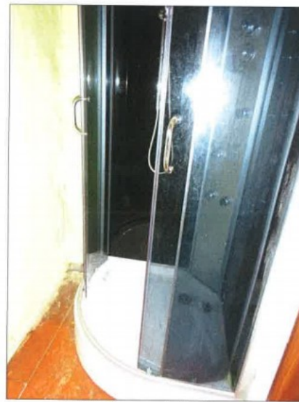
Widok fragmentu łazienki z wc.