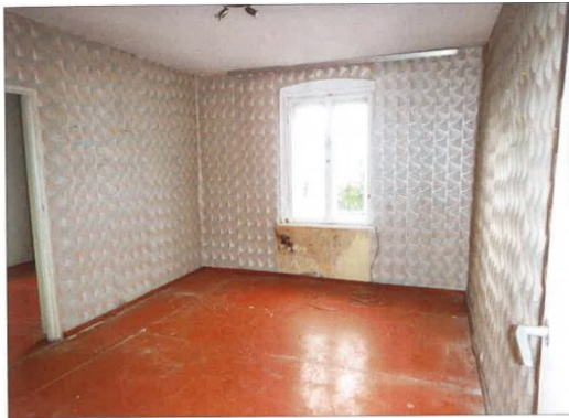
Widok fragmentu pokoju.