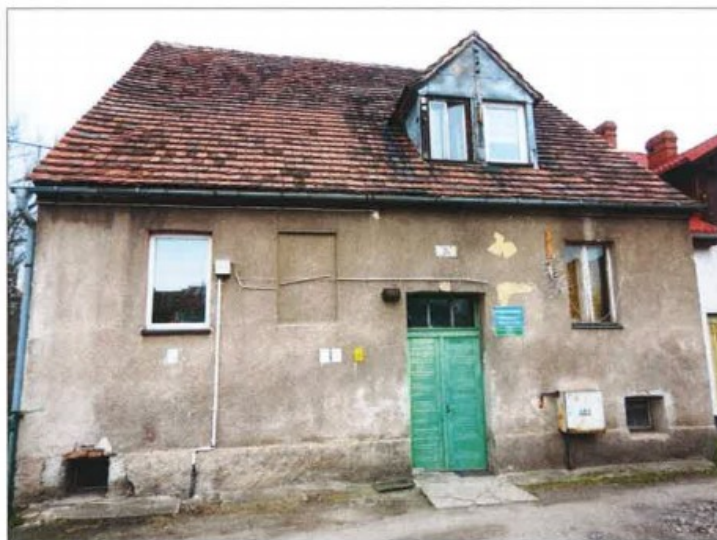
Widok elewacji frontowej– ul. Włókiennicza nr 5a.

na sprzedaż lokalu mieszkalnego Nr 3 znajdującego się w budynku położonym w Lubaniu przy ul. Włókienniczej 5a wraz z udziałem we współwłasności nieruchomości gruntowej (działka nr 57/13, AM 18, Obręb II o powierzchni 478 m 2 , JG1L/00028431/2)