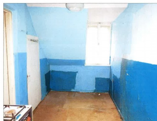
Widok fragmentu kuchni.