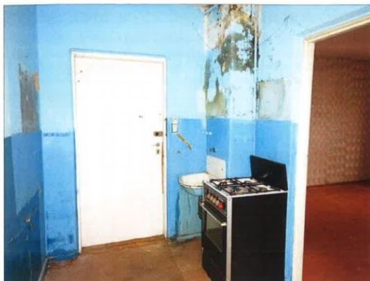
Widok fragmentu kuchni.