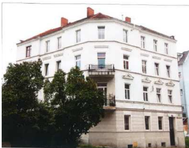
Widok elewacji frontowej – ul. Armii Krajowej 24.

na sprzedaż lokalu mieszkalnego Nr 2A, znajdującego się w budynku położonym w Lubaniu przy ul. Armii Krajowej 24 wraz z udziałem we współwłasności nieruchomości gruntowej (działka nr 49/5, AM 19, Obręb II o powierzchni 248 m 2 , JG1L/00016414/0)